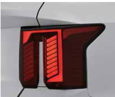
Светодиодные задние фонари