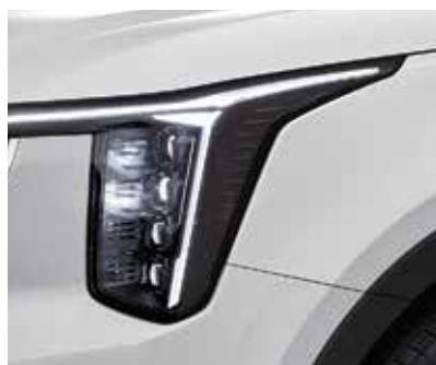
Проекционные светодиодные фары