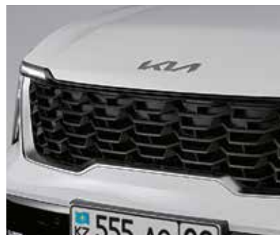
Черная решетка радиатора