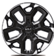
Легкосплавные диски 18"