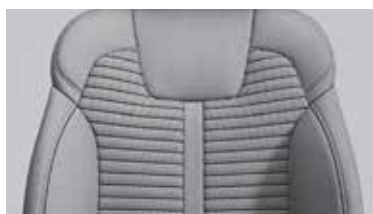
Ткань с тиснением