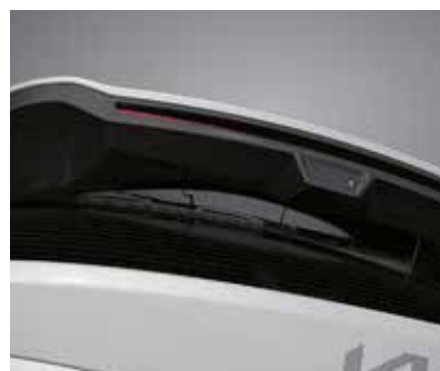
Скрытый стеклоочиститель на заднем стекле