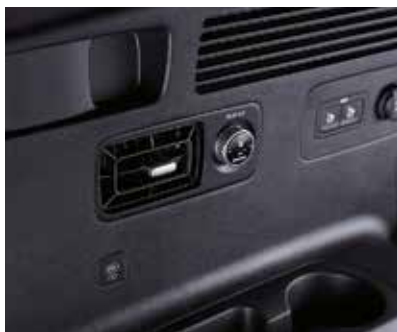
Кондиционер для третьего ряда сидений