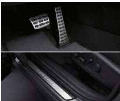
Металлические накладки на педалях / дверных порогах