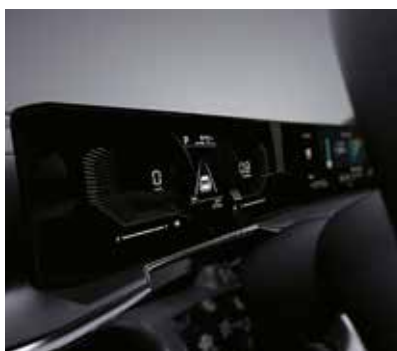
Панель приборов Supervision 4.2"