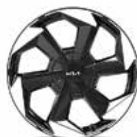
Легкосплавные диски 19"