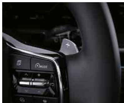
Подрулевые «лепестки» переключения передач