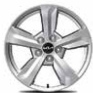
Легкосплавные диски 17"