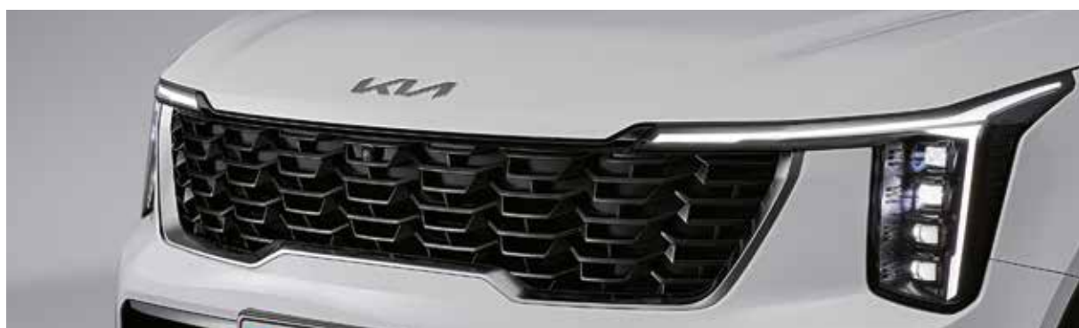
Решетка радиатора с отделкой черным глянцем