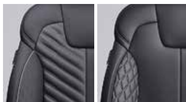
Кожа сорта Нарра с прострочкой