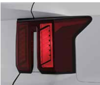
Обычные задние фонари