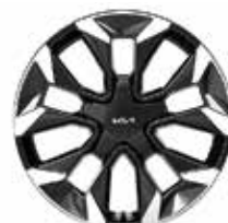
Легкосплавные диски 20"