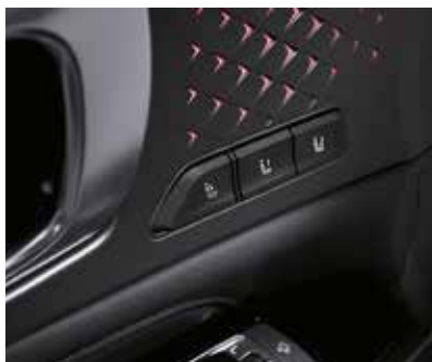
Память настроек сиденья водителя