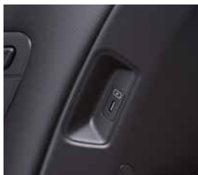
Дополнительные зарядные устройства USB в спинках сидений первого ряда