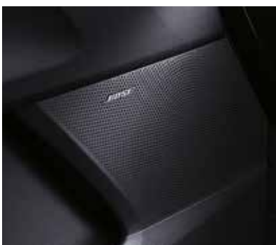
Аудиосистема премиум-класса Bose® с 12 динамиками