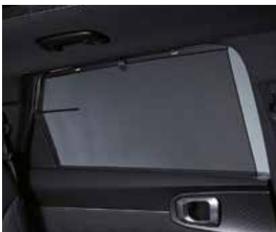
Солнцезащитные шторы для второго ряда сидений