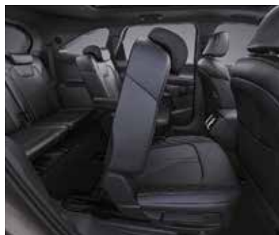
Облегченная система входа на второй ряд одним нажатием кнопки